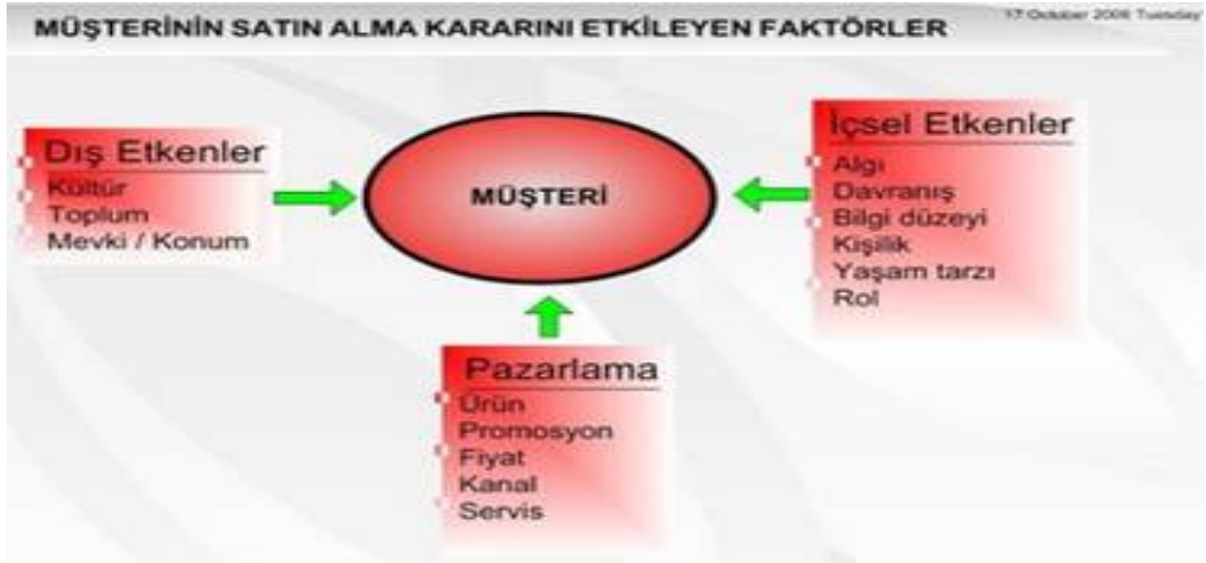
Şekil 1.1: Satın alma kararı etkileyen faktörler