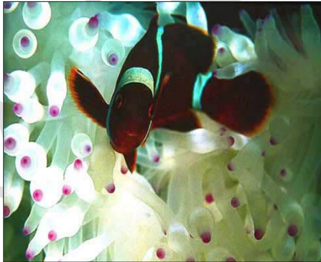
Fotoğraf 1.4: Su altı fotoğraf örnekleri (Fotoğrafçı: Ebru TUNCER-Malezya)