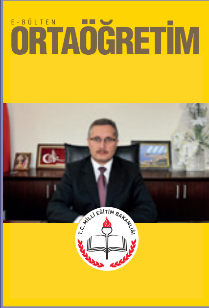
Ortaöğretim E-Bülten 1