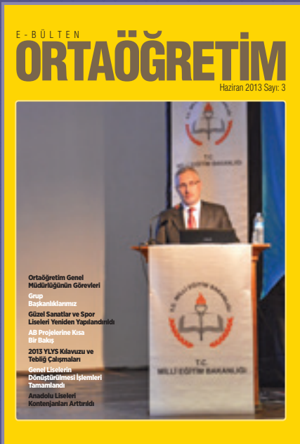
Ortaöğretim E-Bülten 3