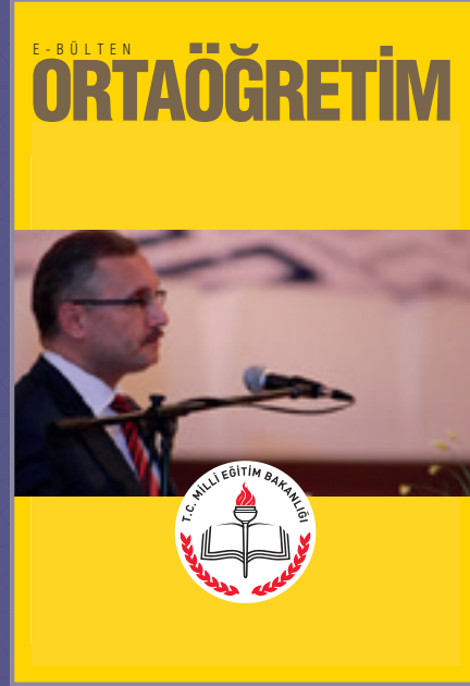
Ortaöğretim E-Bülten 2