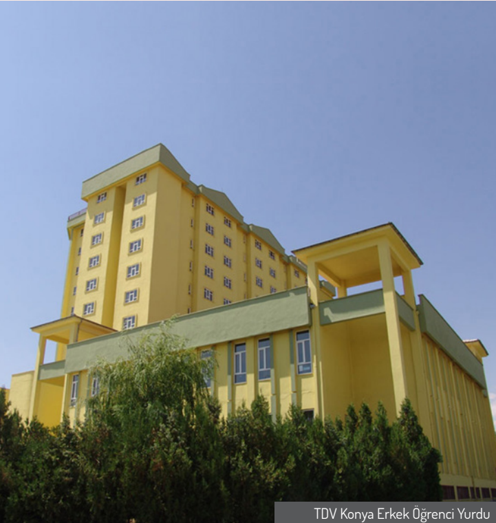
TDV Konya Erkek Öğrenci Yurdu

Programa kabul edilen öğrenciler fakülterle yakınlık ve diğer fiziki imkânlar düşünülerek huzurlu, rahat bir barınma ve çalışma ortamı olan, uygun ve nezih mekânlarda barındırılmaya çalışılmaktadır. Bu amaçla TDV, öğrenci yurtlarını öğrencilerimizin istifadesine sunmaktadır. TDV yurtları olmayan illerde ise anlaşmalı yurtlardan hizmet satın alınması yoluyla barınma ihtiyacı karşılanmaktadır.