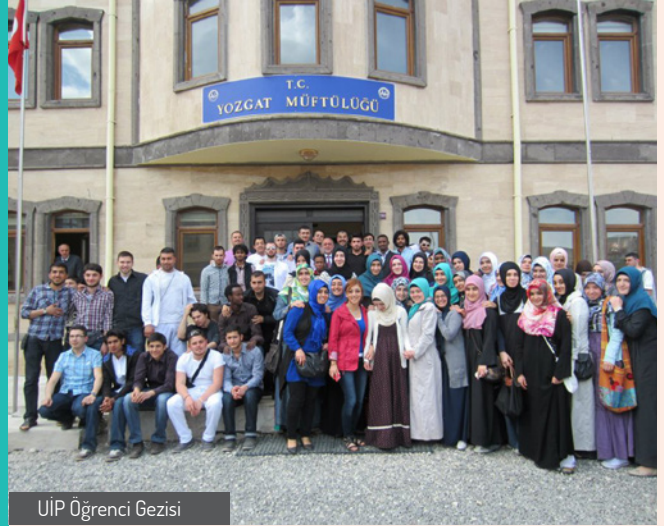
UIP Öğrenci Gezisi