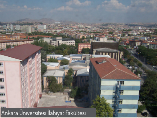
Ankara Üniversitesi İlahiyat Fakültesi