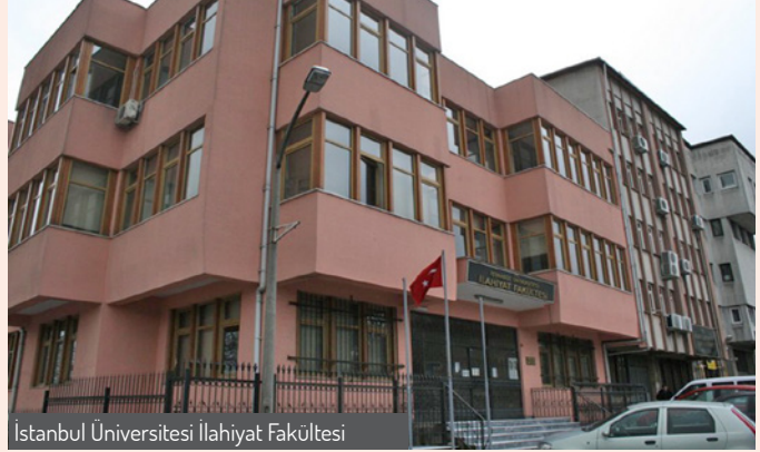
İstanbul Üniversitesi İlahiyat Fakültesi