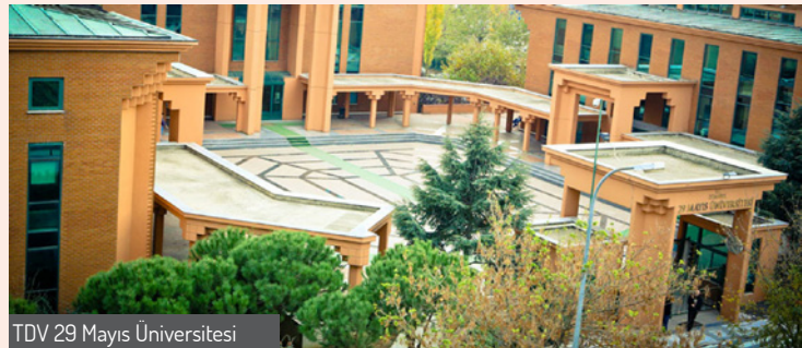
TDV 29 Mayıs Üniversitesi