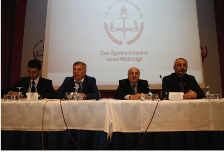
25-26 Eylül 2017 tarihleri arasında gerçekleştirilen Trafik Genel Eğitim Planı Çalıştayı sonuç bildirgesinden görüntüler