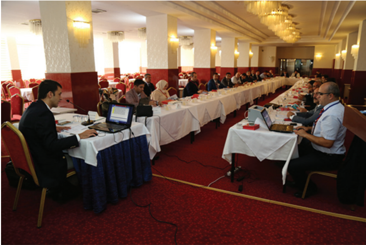
25-26 Eylül 2017 tarihleri arasında gerçekleştirilen Trafik Genel Eğitim Planı Çalıştayı çalışma salonlarından görüntüler