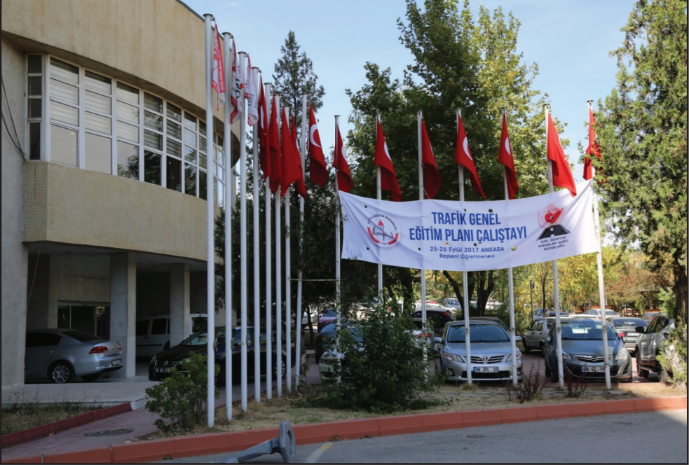
25-26 Eylül 2017 tarihleri arasında gerçekleştirilen Trafik Genel Eğitim Planı Çalıştayı