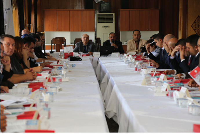
25-26 Eylül 2017 tarihleri arasında gerçekleştirilen Trafik Genel Eğitim Planı Çalıştayı çalışma salonlarından görüntüler