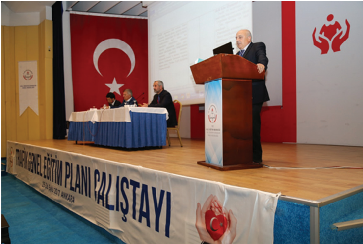
25-26 Eylül 2017 tarihleri arasında gerçekleştirilen Trafik Genel Eğitim Planı Çalıştayı sonuç bildirgesinden görüntüler