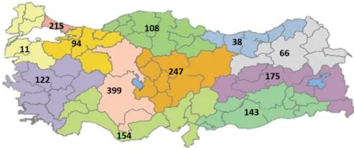
řekil 1: İBBS-1'e Gre Yeni COVID-19 Hasta Sayısı, Trkiye