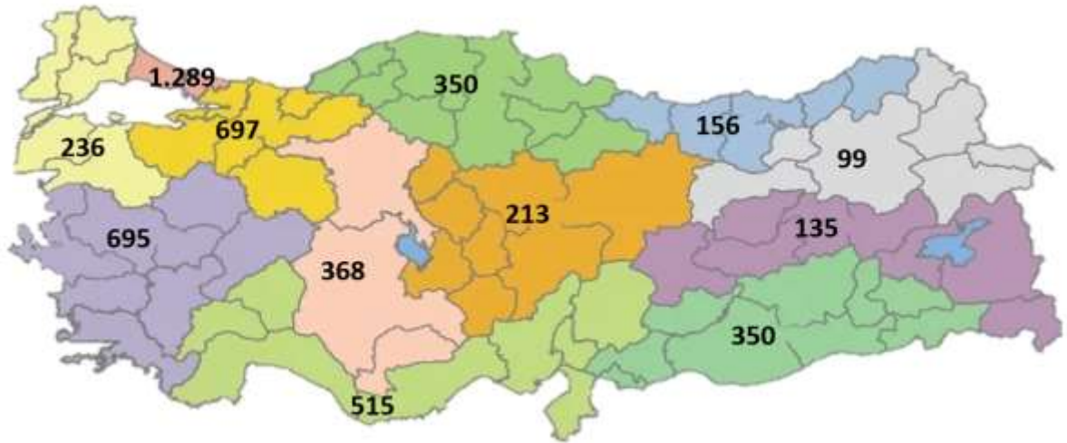
Şekil 1: İBBS-1'e Göre Yeni COVID-19 Hasta Sayısı, Türkiye